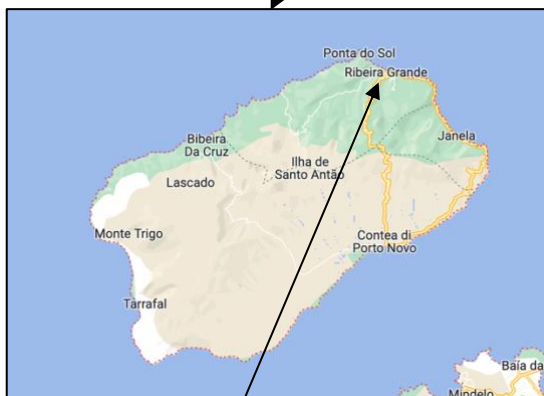
Ile de Santo Antao: Communauté de Ribeira Grande