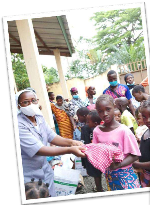
Distribuzione di vestiti e alimenti alle vittime delle inondazioni, ad Anyama.

Le nostre Suore si danno da fare, come vere orionine, offrendo vestiti, alimenti e medicine... Affidiamo tutti alla Madonna, N. S. della Speranza, perché presto si superino queste sofferenze.