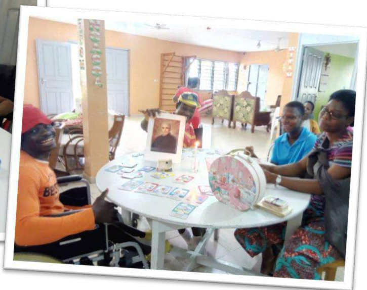
I nostri bambini del Cottolengo di Anyama (Casa di accoglienza "Madre M. Elisa")